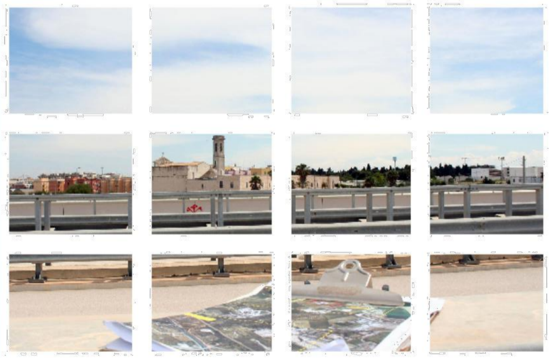
Tavola 2 Vincoli e segnalazioni da strumenti urbanistici su IGM F° 177 IV SO e F° 177 IV SE

S.S. 16 "ADRIATICA" TRONCO BARLETTA - BARI. Lavori di completamento delle aste di collegamento tra la S.S. 16 "Adriatica" e la litoranea (ex S.S. 16) a nord e a sud di Molifetta ed a sud di Giovinnazzo lungo il tratto tra il km 774+200 ed il km 785+600. SISTEMAZIONE FUNZIONALE ROTATORIA E ASSI VIARI DI COLLEGAMENTO TRA IL NUOVO PORTO COMMERCIALE E LE ZONE PRODUTTIVE.