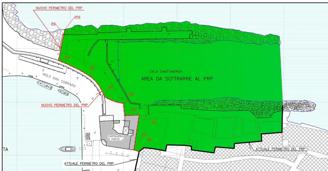
Perimetrazione dell'area da sottrarre al P.R.P.

L'area di Cala Sant'Andrea oggetto di ripermimetrazione, che si interpone tra il Porto ed il centro antico di Molfetta ed è attualmente compresa nelle aree demaniali portuali, ricade nel Foglio n. 55, nelle particelle 4407 e 4408 e in parte della particella 4480, ed ha superficie complessiva, compreso lo specchio acqueo, di circa 19.100 mq.