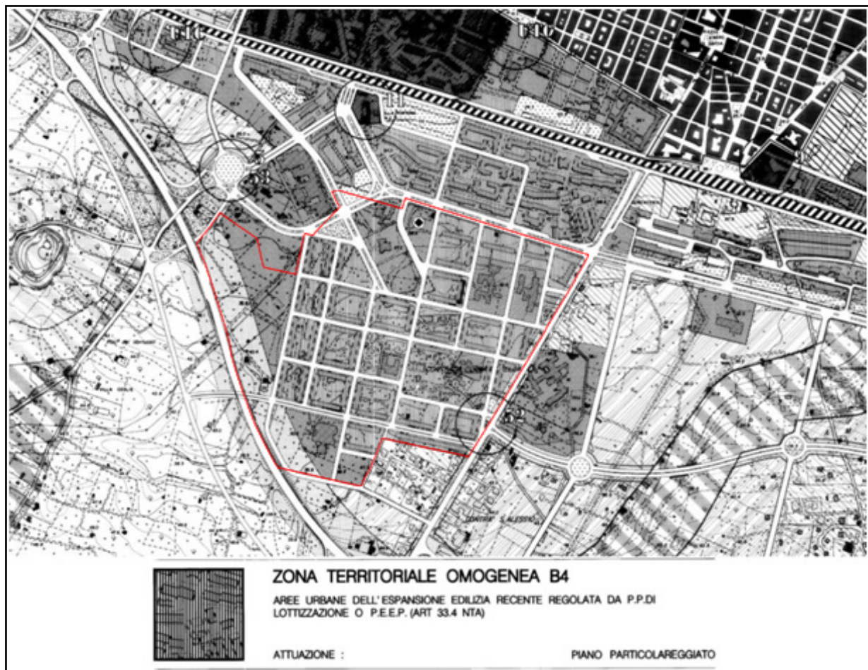
Figura 2 Stralcio Tavv. D04 –D05 – Zone omogenee del PRGC

Usi previsti: Abitazioni (U1), Residenze collettive (U1a), Scuole dell'obbligo (U2), Verde pubblico urbano (U6), Attrezzature di interesse collettivo (U7), Servizi per il culto (U8), Attrezzature sanitarie (U9), Attrezzature di parcheggio (U10), Attrezzature tecnologiche e servizi tecnici urbani (U11), Attrezzature per la mobilità meccanizzata su gomma (U12a), Attrezzature per la mobilità pedonale e ciclabile (U12c), Attrezzature per lo spettacolo e la cultura (U13), Sedi e servizi amministrativi e istituzionali (U14), Pubblici esercizi (U16), Commercio diffuso (U17), Artigianato di servizio (U18), Stazioni di servizio, distributori carburanti e simili (U20), Laboratori artigianali compatibili con la residenzialità (U21), Usi vari di tipo diffuso (U22), Attrezzature per il soggiorno temporaneo (U30)."