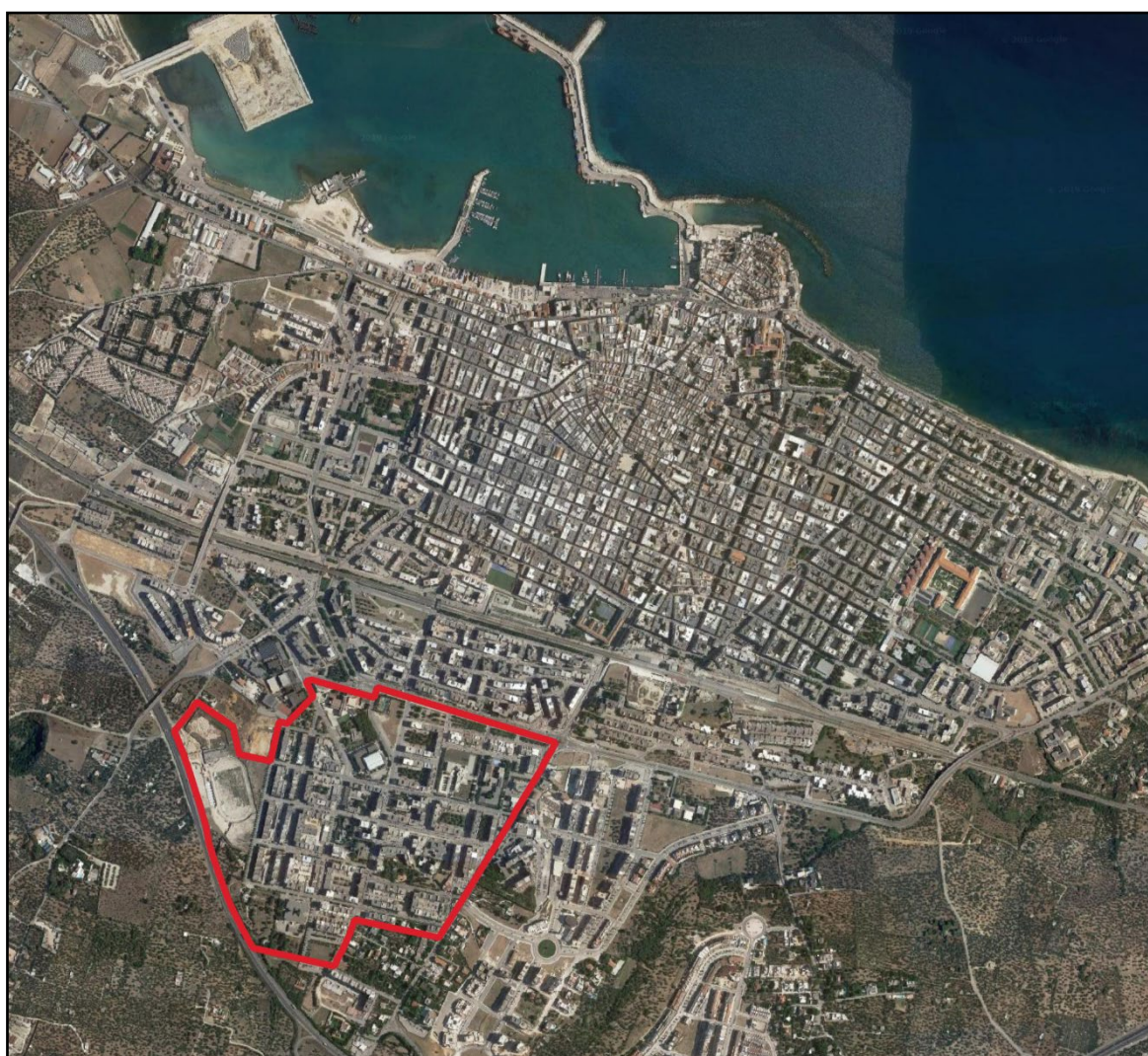
Figura 1: Individuazione di una porzione di territorio omogenea nell'intorno della sottozona B4 del P.R.G.C.

Per la verifica degli standard, trattandosi di servizi a livello territoriale, è stata considerata un'area omogenea della sottozona B/4 di PRGC delimitata a Nord dal limite urbanistico del Comparto 15 del PRGC (zona omogenea C1), dal polo scolastico liceale e via Monsignor Achille Salvucci; a Sud-Ovest dalla S.S. 16 bis e dal limite urbanistico della zona omogenea Ca del PRGC; infine a Est da via Terlizzi.