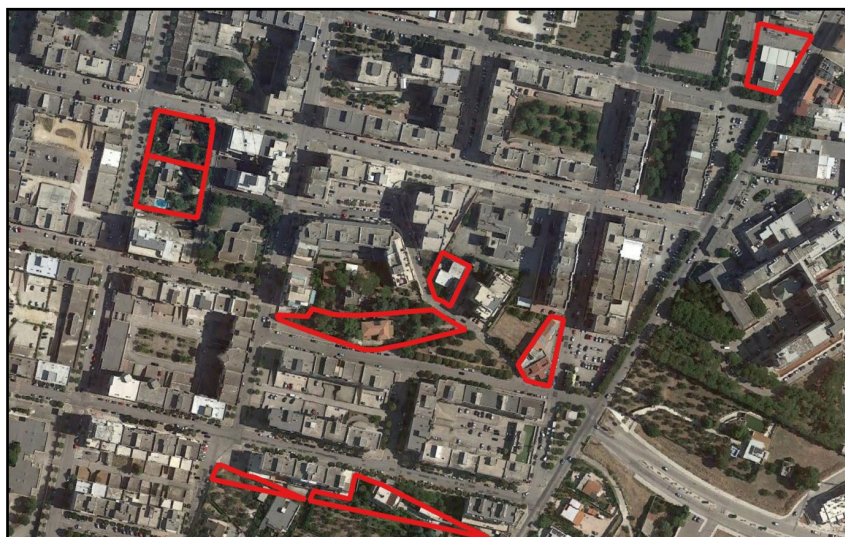
Figura 3 Perimetrazione aree parzialmente edificate

La progettazione è articolata principalmente su aree che possiedono potenzialità edificatoria residua; ad esclusione dei lotti G e H, per la restante parte è stata sviluppata la massima superficie totale fuori terra di progetto realizzabile (STo).