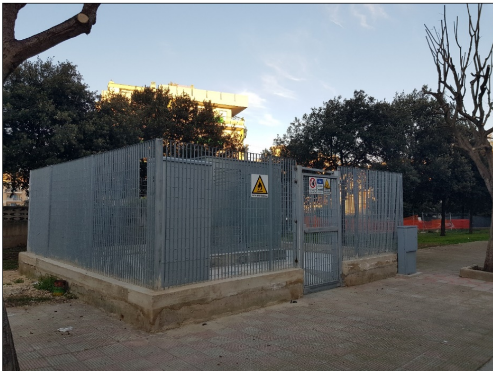
Figura 5 Cabina di riduzione della pressione del gas cittadino da spostare in via Salvador Allende

Le principali opere di urbanizzazione primarie e secondarie sono già presenti, trattandosi di una zona residenziale di completamento urbano. Le uniche opere da realizzare, derivanti dalla nuova progettazione sono: la sistemazione di un'area a parcheggio a confine con il comparto C.A. a sud, marciapiede e parcheggio in Via del Gesù e lo spostamento di una cabina di riduzione della pressione del gas cittadino nell'area oggi destinata a parcheggio delimitata da via Terlizzi, via Salvador Allende e via Molfettesi D'Argentina.