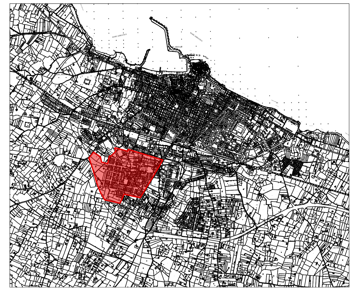
PERIMETRAZIONE DI UNA PORZIONE DI TERRITORIO OMOGENEA NELL'INTORNO DELLA SOTTOZONA B4 DEL P.R.G.C. DEL COMUNE DI MOLFETTA