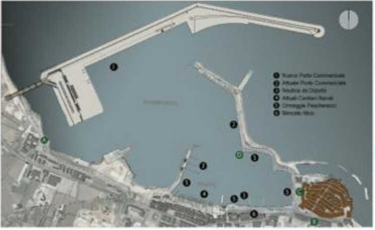
INQUADRAMENTO GENERALE STATO ATTUALE - SCALA 1:7000