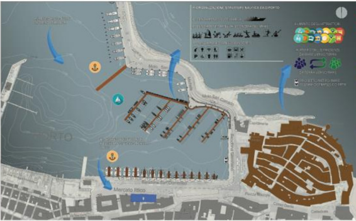
NAUTICA DA DIPORTO, PORTO PESCHERECCIO: IDEA PROGETTUALE - SCALA 1:2000