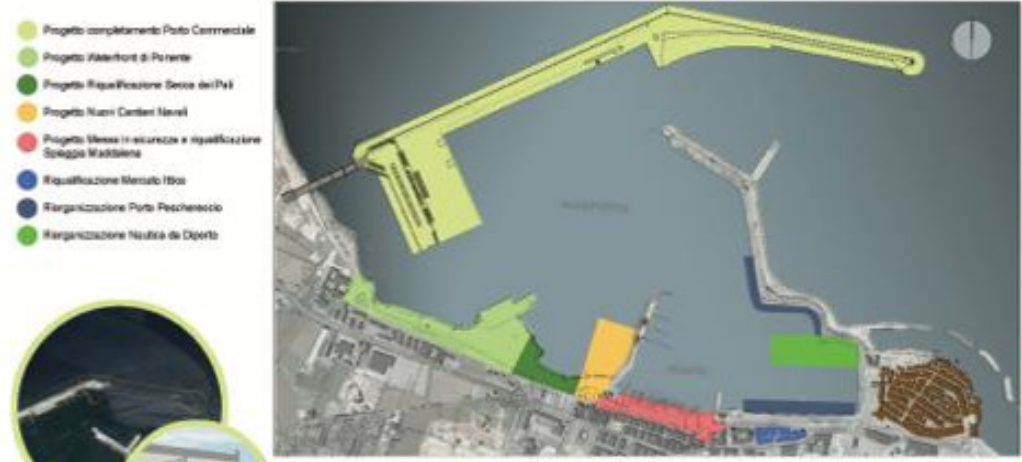
INTERVENTI PROGRAMMATI - SCALA 1:7000

ALTRI ATRATTORI TURISTICO-CULTURALI DEL CENTRO STORICO ANALISI STATO ATTUALE ✓ Porto portuale, antica tradizione marinara e contadina, presenza del Mercato Ittico, posizione strettamente connessa alla città. ✗ Discontinuità organizzativa delle funzioni soprattutto per pescherecci e nautica da diporto. Stati del peschereccio disorganizzati, 200 posti barca di piccole dimensioni. Cantieri Navali obsoleti, collegamento tra il Duomo e la Madonna dei Martiri interrotto da Spiaggia Maddalena.