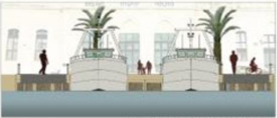
PORTO PESCHERECCIO DETAGLIO - SCALA 1:150