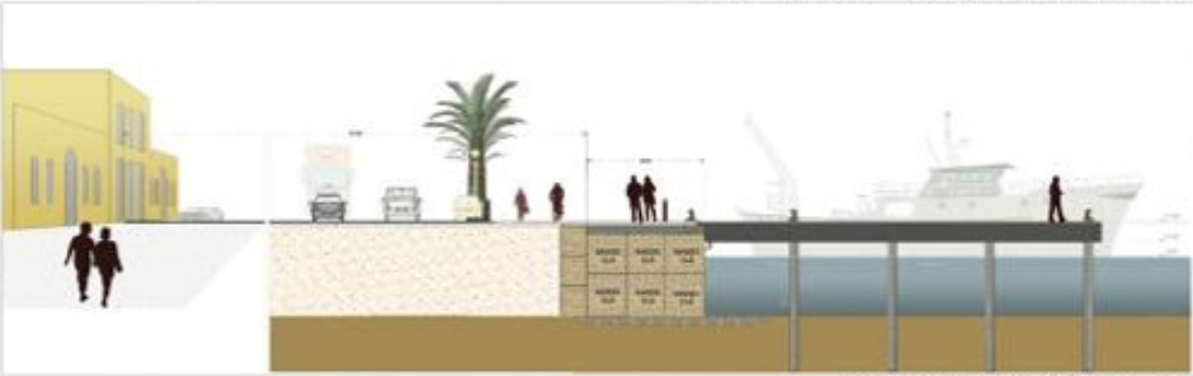
SEZ B-B' - PORTO PESCHERECCIO PONTILI - SCALA 1:150