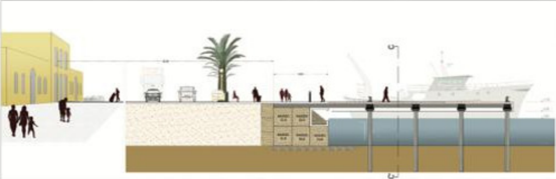
SEZ A-A' - PORTO PESCHERECCIO AVANZAMENTO BANCHINA - SCALA 1:150