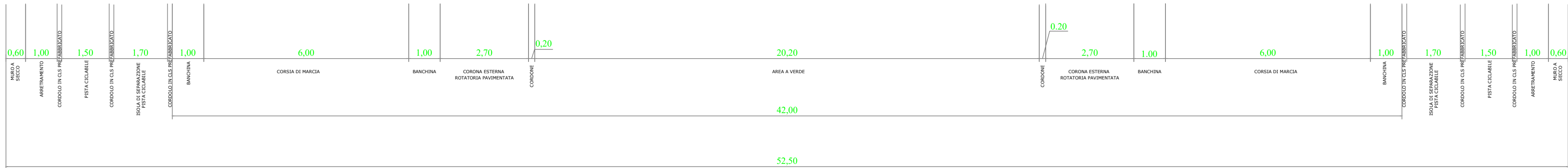
SEZIONE TIPO ROTATORIA